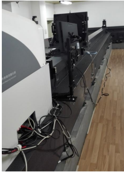
图 2. 激光差动共焦超长曲率半径测量装置

目前球径仪的曲率半径样板无法做到有效溯源，市场上外国企业销售到中国的仪器也无从验证其准确度，因此曲率半径的样板的计量校准规范修订变得尤为重要。市场上除了接触式球径仪，还有自准直显微法曲率半径测量仪，他们的校准都需要球径仪样板进行校准，《球径仪》检定规程的修订的亟待解决。本次修订正是在 JJG 465-1986 《球径仪样板试行检定规程》基础上，参照 JJF 1831—2020 《球径仪校准规范》对样板的需求，并依据 JJF 1071-2010 《国家计量校准规范编写规则》国家计量技术规范进行编写。