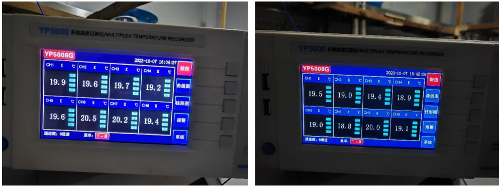
图 4 标准器采集数据状况