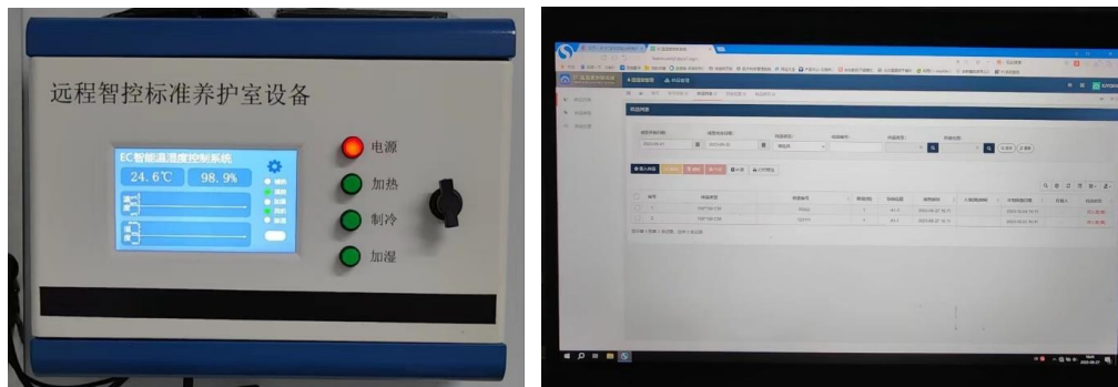
图3 试验现场采集状况