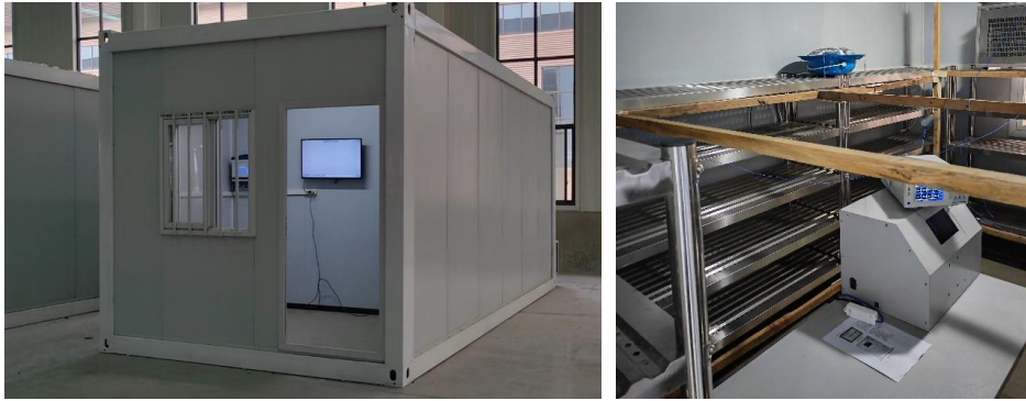
图2 可移动式标准养护室外观及现场试验情况

规范编写过程中，对可移动式标准养护室的计量特性所涉及的具体指标进行了试验验证，并与生产厂家和监测机构开展了广泛调研，确定指标可以服务于现阶段计量测试工作。测试环境如下图：